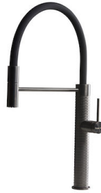
Monomando Skin Gun Metal