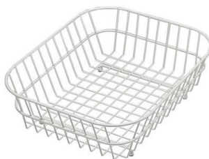
Cesta blanca de acero inoxidable 8612 000