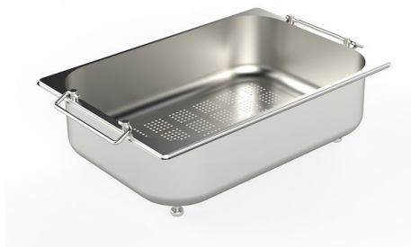
escurre pasta en acero inoxidable 8154 000