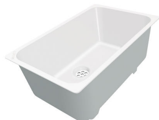
Cubeta blanca 8153 100