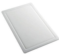
Tabla de corte de HPDE 8657 001