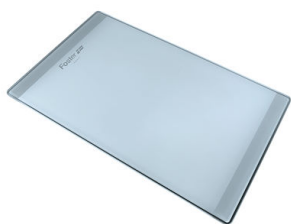
Tabla de corte de cristal 8631 300